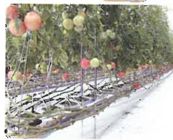
岐阜県就農支援センター (トマト独立ポット耕栽培システム)